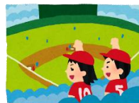
③watch a baseball game

3 動物園からある動物が逃げ出しました。それは何でしょうか。アルファベットを聞き取って正しくならべかえて書きましょう。